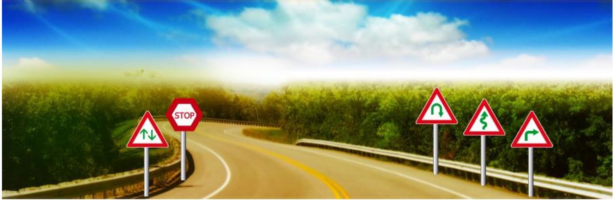
Warning Road Signs in Pakistan

These signs normally in triangle shape and warn you, for example there is a curved round coming after 30 feet's or there is bend coming in road.